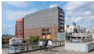
ビジネス・レジャーの 拠点

JR津田沼駅に乗り入れる総武線は東京駅や千葉駅だけでなく、舞浜リゾートエリアを有する舞浜駅へもアクセス良好。ビジネス・レジャーの拠点として大変便利な立地です。