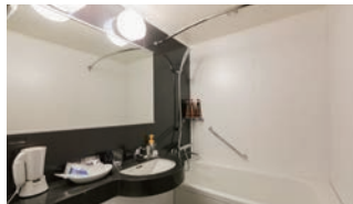
足を伸ばせる バスタブ

フロントロビーでお好きなアメニティをお持ちいただけるサービス「アメニティステーション」を設置。スキンケア用品、豊富な入浴剤、カミソリ、ヘアブラシなどをご用意しています。