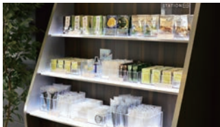
自由に選べる アメニティ

JR津田沼駅に乗り入れる総武線は東京駅や千葉駅だけでなく、舞浜リゾートエリアを有する舞浜駅へもアクセス良好。ビジネス・レジャーの拠点として大変便利な立地です。