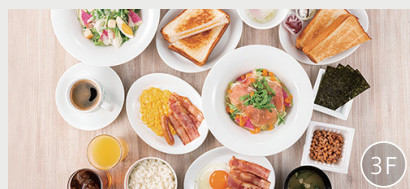
朝食会場「デニース」

朝食時間 6:00~11:00 メインメニュー5種+サイドオプション5種+ドリンクバーを組み合わせたプレート。朝食券を780円分(税込)のお食事券としてもご利用いただけます。