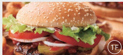
朝食会場「バーガーキング」

朝食時間 6:00~11:00 メインメニュー5種+サイドオプション5種+ドリンクバーを組み合わせたプレート。朝食券を780円分(税込)のお食事券としてもご利用いただけます。