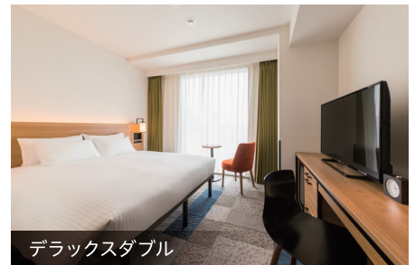
デラックスダブル