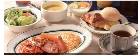
朝食会場「DINING RESTAURANT KITEKI」