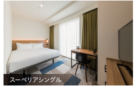
スーペリアシングル