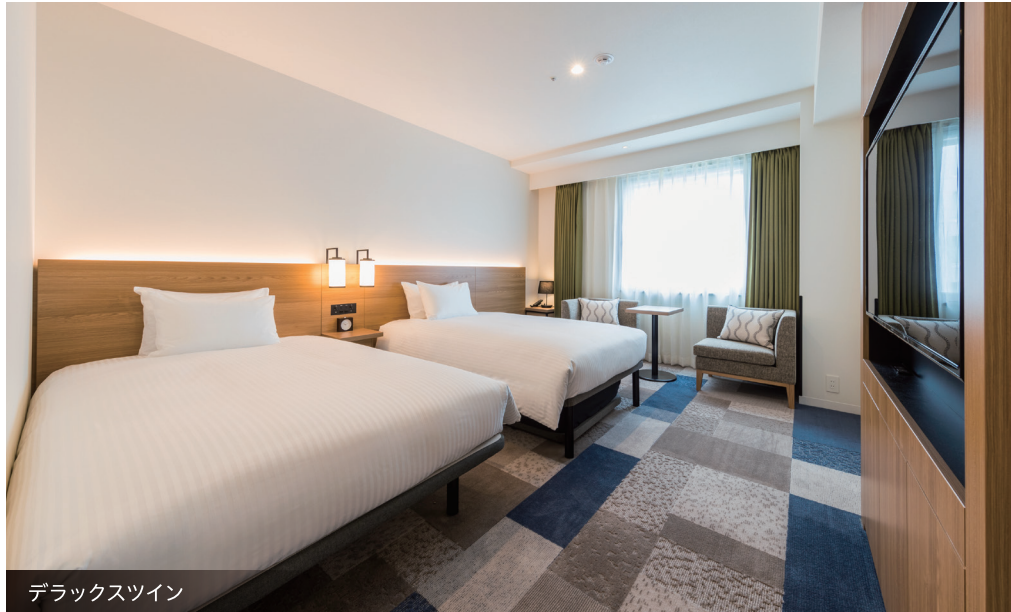
デラックスツイン