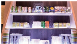
自由に選べるアメニティ

フロントロビーにお好きなアメニティをお持ちいただけるサービス「アメニティステーション」を設置。スキンケア用品、豊富な入浴剤、カミソリ、ヘアブラシなどをご用意しています。