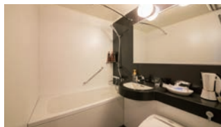
足を伸ばせるバスタブ

シングルルームを中心に最大5名様までご利用いただける客室をご用意。自然と和のエッセンスを取り入れた客室はビジネス・レジャーに関わらずごゆっくりお過ごしいただけます。