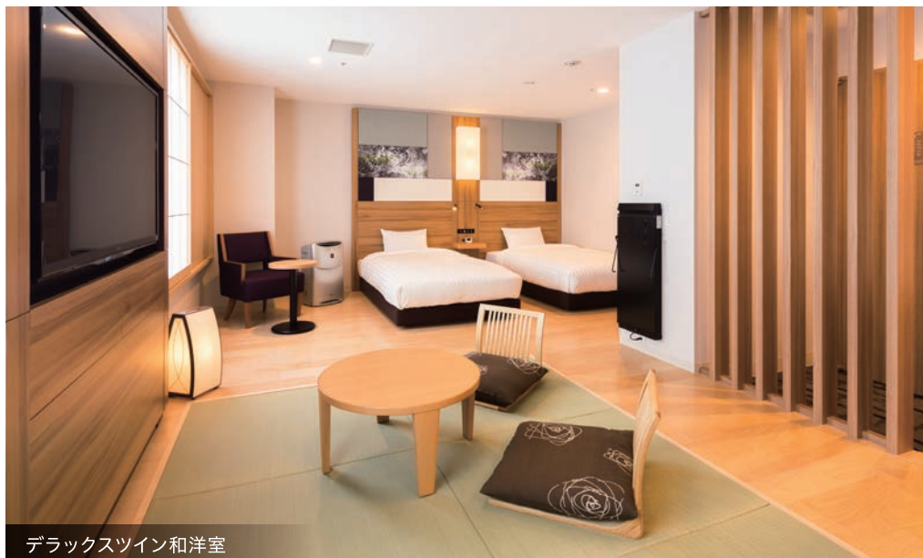
デラックスツイン和洋室

和と自然のぬくもりあふれる落ち着いた空間 武蔵野の自然と和のエッセンスを取り入れた心穏やかに過ごせる客室