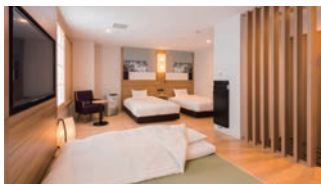
多様なニーズに対応する客室

フロントロビーにお好きなアメニティをお持ちいただけるサービス「アメニティステーション」を設置。スキンケア用品、豊富な入浴剤、カミソリ、ヘアブラシなどをご用意しています。