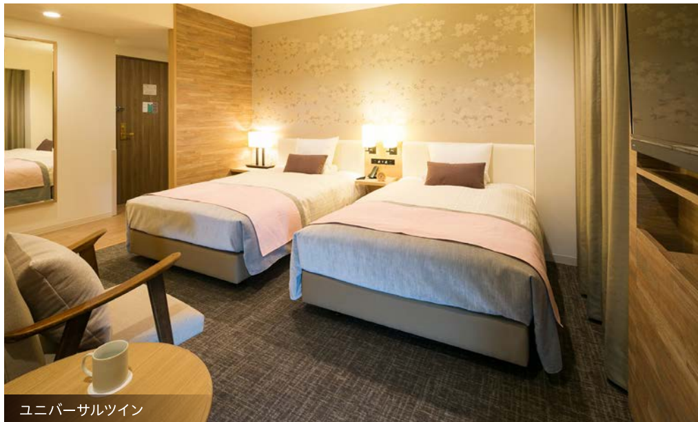
ユニバーサルツイン

心地よいベッド、広々としたバスルーム、シングルは15m 2 へのゆとりある客室。 ご連泊や長期ご滞在でもゆったりとお過ごしいただけます。