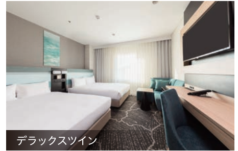
デラックスツイン