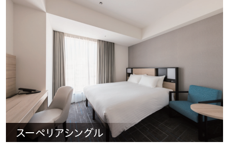
スーペリアシングル