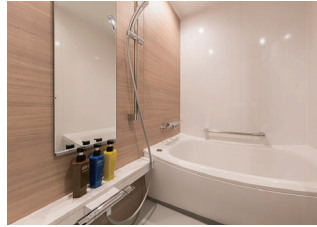
バスルームはトイレと別のセパレートタイプ

上質で豊かなご滞在を体感していただけるよう、プレミアアメニティとリラックスタイムをご用意しています。