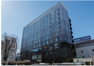
JR五反田駅より徒歩1分の好立地