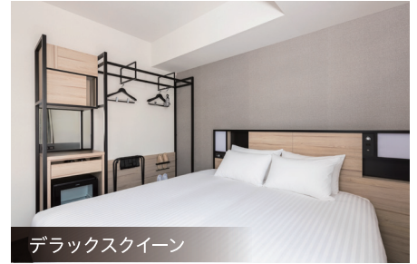
デラックスクイーン