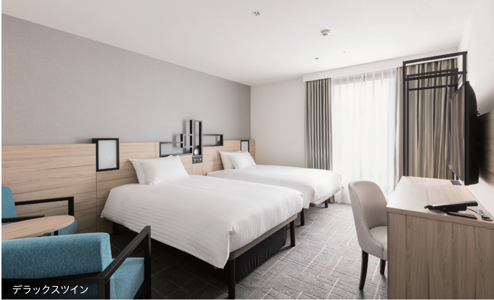
デラックスツイン

五反田にかけて広がっていた田園の風景をデザインに取り入れた “Square”をテーマにした心地よい空間