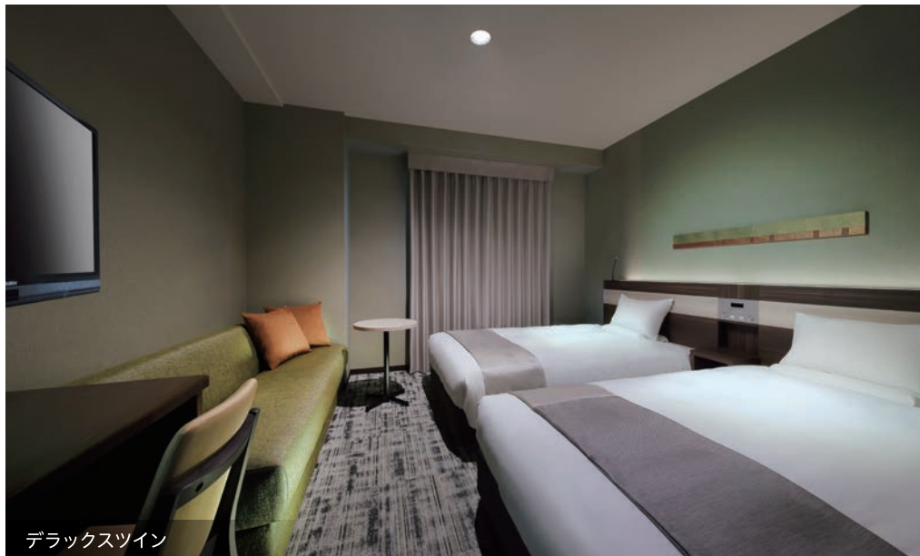
デラックスツイン

「福島」という土地の風土を感じられる空間にはワイドデスクを完備。 女性専用のレディースルームもあり、ビジネスでもレジャーでもご満足いただけます。