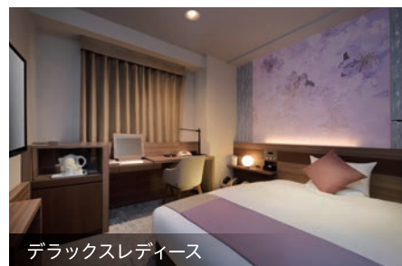
デラックスレディース