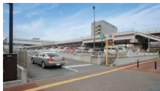
150台駐車可能 平面駐車場有