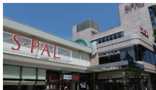
駅ビルまで徒歩2分

デラックスフロア(5階)スーパーフロア(6階)にはレディースルームを完備。お部屋にはフットマッサージ機、フェイススチーマーをご用意しております。