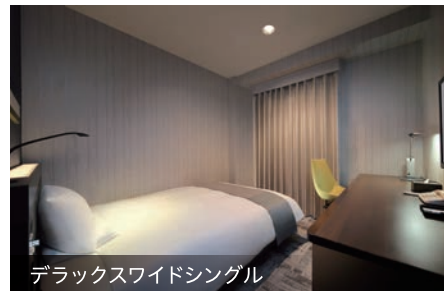
デラックスワイドシングル