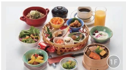
朝食会場「東北寿し 肴 福ぐら」 朝食時間 6:30~10:00(L.O.9:30)

落ち着いた空間で、福島県をはじめ東北六県の食材をふんだんに使用した朝食をご用意しております。