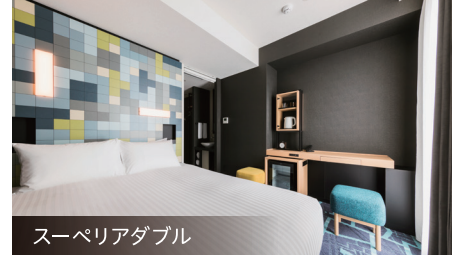
スーパーリアダブル