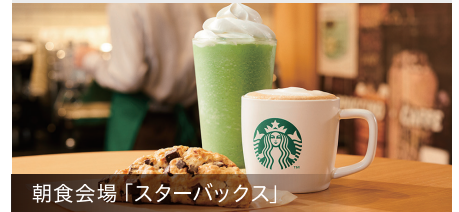
朝食会場「スターバックス」

こだわりの食材を使用したサラダや和洋惣菜、主食には厳選したコシヒカリと栄養価が高いキヌアを使用した雑穀ごはん、こだわりの湯種食パンをご用意したモーニングビュッフェです。朝食券を1,400円(税込)のお食事券としてもご利用いただけます。