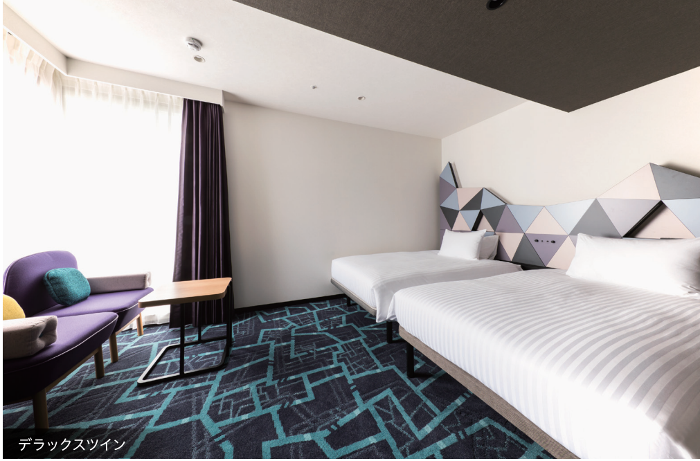
デラックスツイン

秋葉原の電気街やポップカルチャーをイメージしたデザイン さまざまなお客さまのニーズに合う、デザインと快適さが交差する心地よい空間