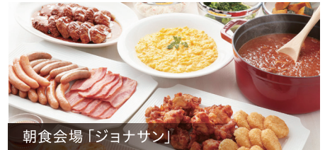
朝食会場「ジオナサン」