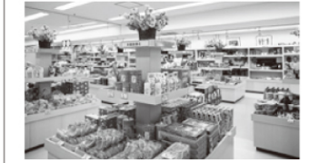
きたかみかんこうぶつさんかんあくせす 北上観光物産館アクセス

北上のお土産品が一堂に会する、北上駅前の物産館。農産物からお菓子などの加工品、地酒、工芸品など幅広い品揃えでお待ちしております。