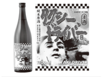
タクシードライバー Taxi driver

北上市の老舗蔵元「喜久盛酒造」の5代目が立ち上げた、話題の日本酒銘柄。意表をつくネーミングやラベルが目が行きがちですが、岩手県産の飯米「かけはし」の力強い味わい、確かな旨みとキレのある飲み口で人気のお酒です。