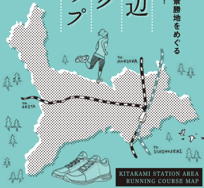
KITAKAMI STATION AREA RUNNING COURSE MAP

北上駅前から走り出す 北上展勝地、北上川、岩手の景勝地をめぐる 気分爽快なりフレッシュラン！