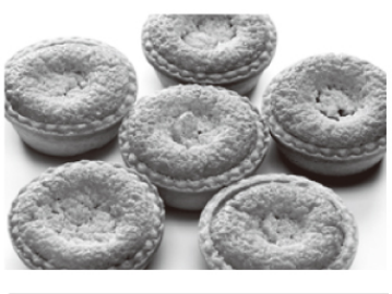
二子さといも サクサクもちりタルト Futago-satoimo sakusaku mocchiri tart

展望地の桜のチップで薄紅に染め上げられた、ハンカチやコースターをお土産に。かつて北上市極楽寺で行われていたという草木染めを、展望地の桜で復活させたいという思いから生まれた、北上ならではの逸品です。