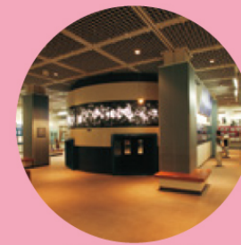
宮沢賢治記念館【花巻市】

細かすぎてもきっと伝わる!? SNSなら「いいね!」が増える!? ツウな地元ネタを集めました!