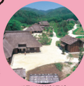
遠野ふるさと村【遠野市】