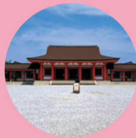
歴史公園えさし藤原の郷【奥州市】