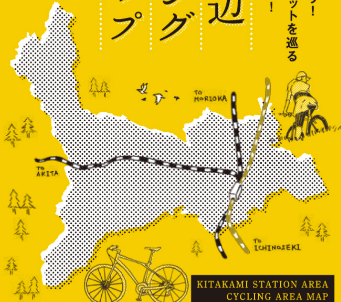
KITAKAMI STATION AREA CYCLING AREA MAP

北上駅前から街に繰り出そう！ 地元のおすすめクチコミスポットを巡る 寄り道必須のサイクリング旅！