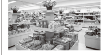
北上観光物産館アクセス

北上のお土産品が一堂に会する、北上駅前の物産館。農産物からお菓子などの加工品、地酒、工芸品など幅広い品揃えでお待ちしております。