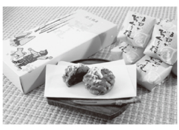
五郎がびっくり焼 Goro ga bikkuri-yaki

ゴマを練り込んだ小豆餡に、たっぷりの胡桃が乗った贅沢な焼き菓子。北上市開祖の黒沢尻五郎正任に捧げる、純和風の北上銘菓。ネーミングの可愛らしさと、味わいの奥深さに、食べた人も思わず「びっくり」!