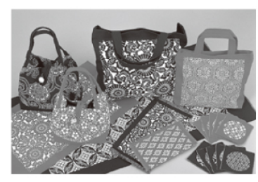
南部型染 Nanbu katazome

北上名産の「二子さとも」を使用して作られたチョコレートケーキ。相性のよいチョコレートを厳選し、ベースとカット状のダブルの頭芋を加え練り込まれており、二子さとも特有の強い粘りとココ、なめらかな食感が特徴。(株)アリーブ、ラタヴェルナ、ドルチッマ(楽天ショップ)各店舗で取扱い。